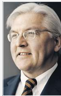
Frank-Walter Steinmeier: Spielt europäische Konflikte herunter.

Erstmals ist ein Ruck durch Europa gegangen, bilanzierte Außenminister Frank-Walter Steinmeier (SPD) die jetzt zu Ende gehende EU-Ratspräsidentschaft. Berufsoptimisten wie der Außenminister haben sich offenbar nicht von dem elenden Gezerre der vergangenen Tage beeindruckt lassen. Aber der Streit mit Polen und Großbritannien zeigt, welchen Fliehkräften die Union ausgesetzt ist. Beide Länder machten deutlich, dass ihnen das eigene Interesse über das der Union geht: wirtschaftlich wie politisch. Die Zukunft der EU liegt daher in einer Kern-Union mit klar definierten Zugangsbedingungen, die von allen Ländern eingehalten werden müssen. Der zähe Streit über den EU-Vertrag macht aber auch deutlich, wie sehr die EU mit sich selbst beschäftigt ist. Offenbar scheuen die Eliten eine offene Debatte über den Vertrag, der zu 95 % mit dem alten Verfassungsentwurf identisch ist und der bereits in zwei Volksentscheiden abgelehnt wurde. Die europäische Idee stärkt das nicht. has