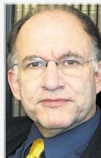
Peter Schaar: Schlamperei in Bundeswehr-EDV

Das ist schon ein starkes Stück: Da sollen im Zentrum für Nachrichtenwesen der Bundeswehr Datenbänder beim Kopieren beschädigt worden sein. Die Kassetten seien nicht mehr lesbar gewesen – also fort damit! So liest sich, was mit Daten über Auslandseinsätze der Bundeswehr zwischen 1999 und 2003 passiert sein soll. Wenn es denn so ist, dann haben die Verantwortlichen entweder keine Ahnung von ihrem Job oder mehr als grob fahrlässig gehandelt. Das machen Fachleute wie der Bundesdatenschutzbeauftragte Peter Schaar deutlich. Der nannte die Vorgänge in der Presse eine „unglaubliche Schlamperei“. Es gibt nämlich Datenrettungsspezialisten: Einrichtungen wie Bundeswehr, Polizei und Nachrichtendienste gehören zur Stammkundschaft. Daten von kaffegetränkten Festplatten oder geschredderten Datenbändern zu retten, ist für diese Experten Alltag. Ihm sei neu, so Schaar, dass bei der Bundeswehr nur noch elektronisch archiviert werde. „Es gibt ja auch noch Papierkopien.“ Und wo sind die? swe