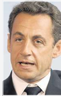
Nicolas Sarkozy: Französische Machtübernahme bei EADS?

Nachdem der neue französische Staatspräsident Nicolas Sarkozy schon auf der Luftfahrtmesse in Le Bourget dafür plädiert hatte, der europäische Luft- und Raumfahrt-Konzern EADS müsse ein „normales Unternehmen“ werden, dürfte in gut zwei Wochen klar werden, was er damit meint. Dann, am 16. Juli, trifft er sich mit Bundeskanzlerin Angela Merkel in Toulouse, dem Sitz von Airbus. Eines war Sarkozys Bemerkung sicher: ein Stacheln gegen die „unnormale“ Doppelspitze der EADS, Mutterkonzern von Airbus. Damit dürfte es bei dem Treffen Merkel-Sarkozy nicht nur um die wirtschaftliche Zukunft von Airbus gehen, sondern auch um diese Doppelspitze, die derzeit von dem Franzosen Louis Gallois und dem Deutschen Tom Enders gebildet wird. Enders Position könnte gefährdet werden, wenn Frankreich wie offenbar geplant, seinen Anteil an EADS erhöht – während die Deutschen ihren wohl eher reduzieren wollen. moc